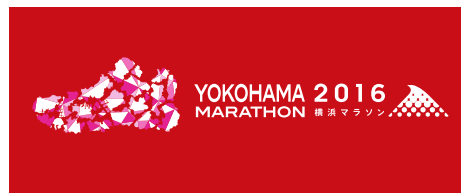
A 横浜18区スニーカー (フェイスタオル)