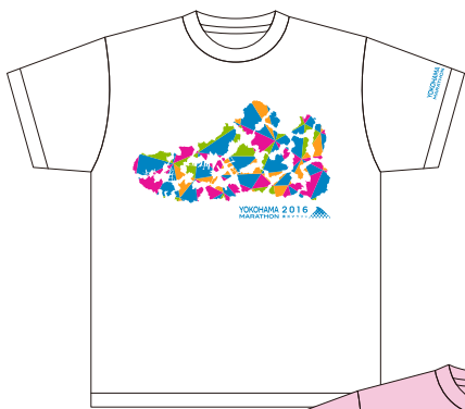
A 横浜18区スニーカー